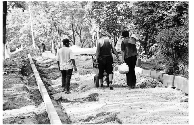
Около домов № 60 – 68 на ул. Адмирала Кузнецова идут работы по благоустройству внутриквартальных проездов